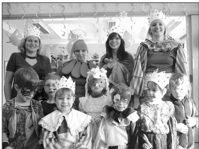
Mateřská škola - karneval