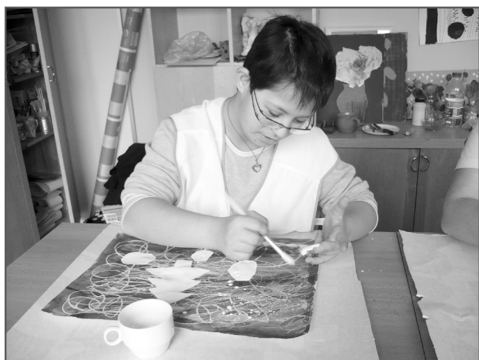
Třída A - výtvarná výchova