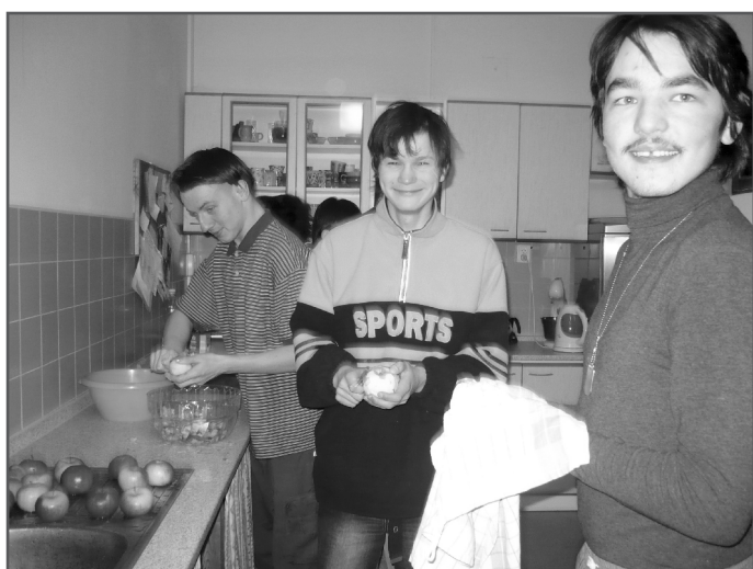
Třída B - pracovní vyučování