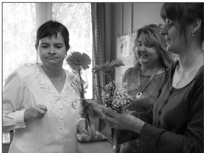
Závěrečné zkoušky v praktické škole

Školní rok 2009/2010 přinesl řadu změn ve složení třídních kolektivů. Rozloučili jsme se s 11 dětmi a žáky a přivítali jsme 10 nových spolužáků. Doufáme, že se jim bude v naší škole líbit a brzy si najdou nové kamarády.