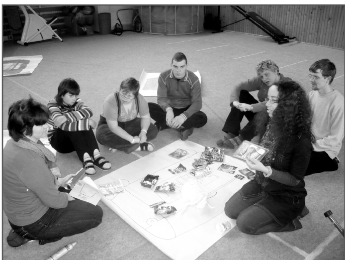
Projekt Třídím, třídíš, třídíme”.